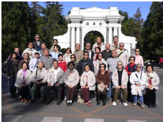
上圖北京浪漫之旅成員攝於清華園入口